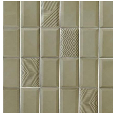
· 西班牙巧克力磚/花磚