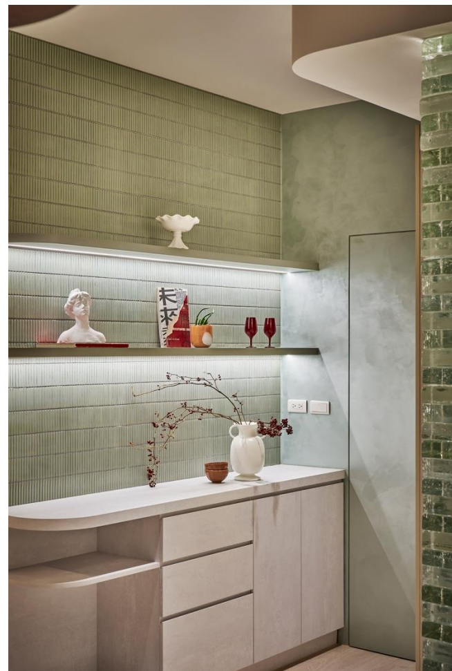
各區域依據需求設計專屬櫃體，既提供收納功能，又具展示效果， 洽談區與會議室則強調流暢的動線與舒適的氛圍，使整體格局既有實用性，又不失優雅與和諧。