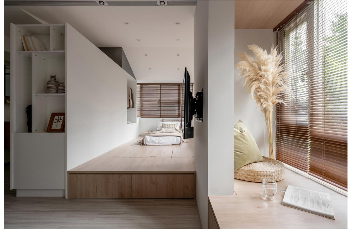
以口字型木框強調窗外綠意，並延窗規劃工作區、閱讀區，享受自然舒適之感 使用灰鏡貼附包樑，透過鏡面反射的語彙，延伸樑線，放大空間視覺