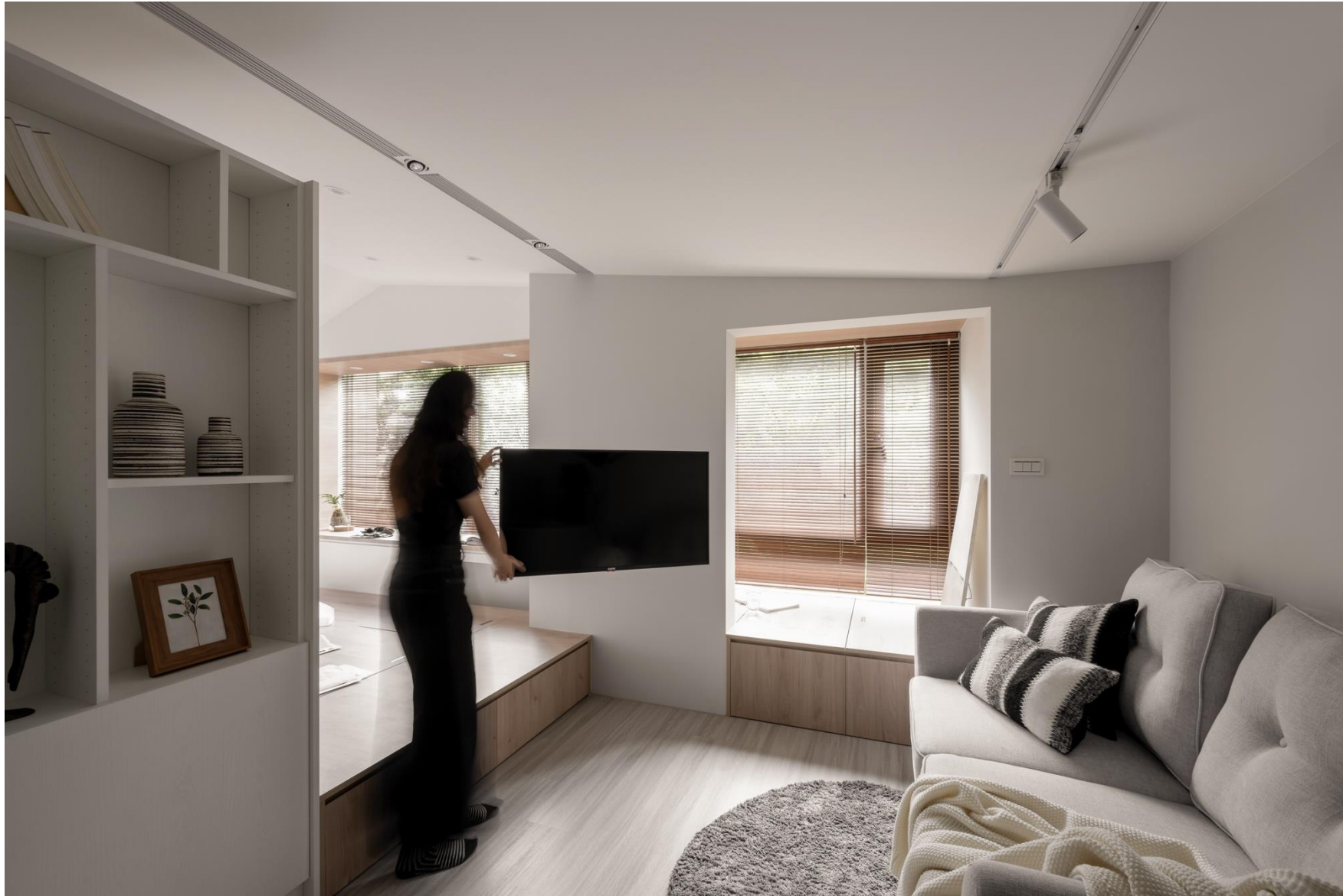
客廳旁側臥榻設計半開放隔牆，保有視覺連繫且部分與公領域錯開，給予用者一處私密閱讀角落 捨棄傳統電視牆，選用可 180 度旋轉的電視壁掛架，無論身在沙發區或臥室皆能觀看影視，同時不佔空間