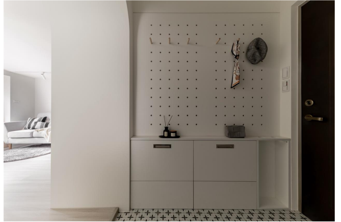
玄關善用垂直空間設置洞洞板，供掛置衣帽等小物，並設置折疊穿鞋椅擁有完善玄關機能 落塵區以幾何花磚延伸視覺，半拱門造型和櫃下線條則引導人們深入宅內