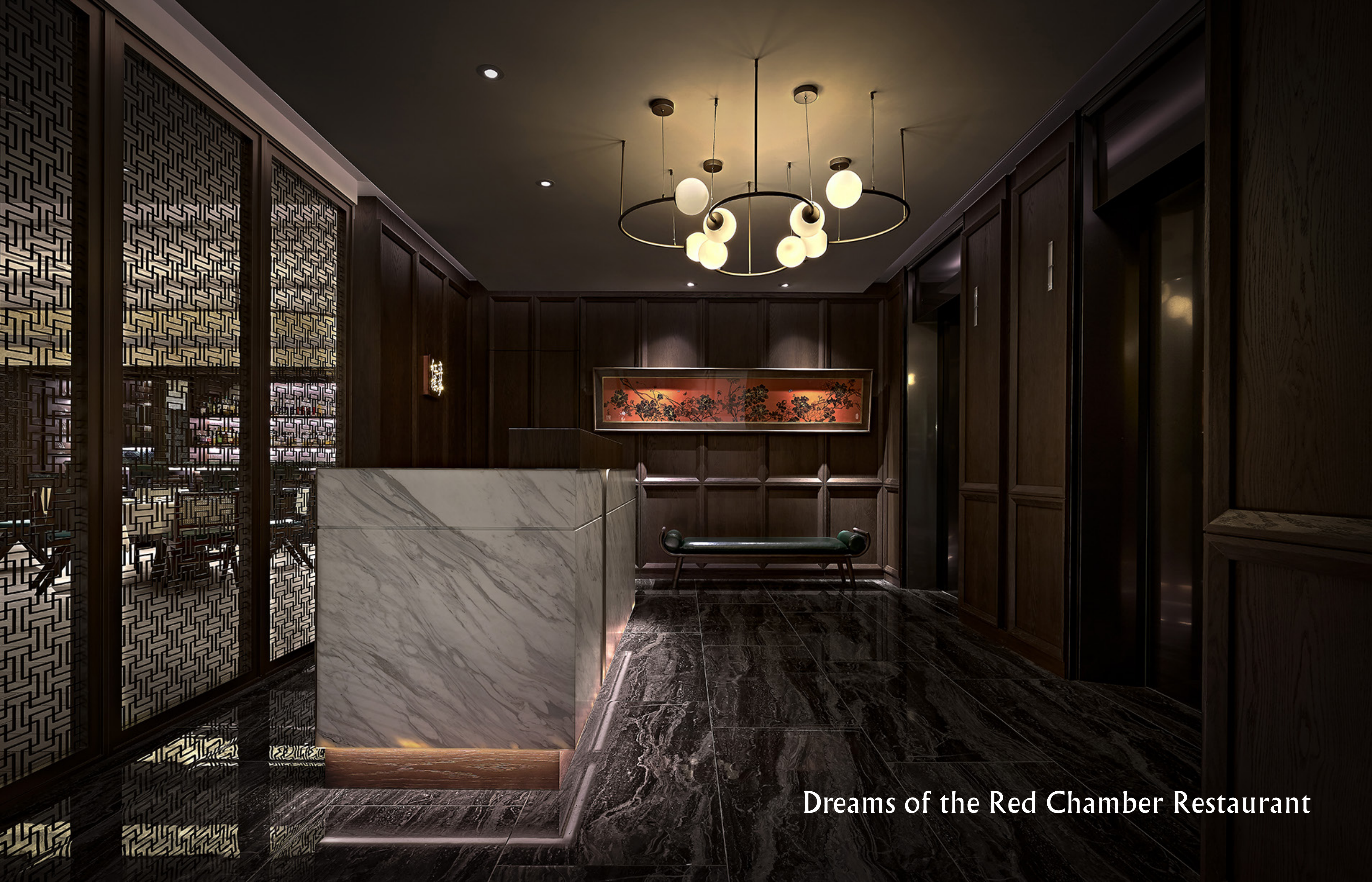
Dreams of the Red Chamber Restaurant