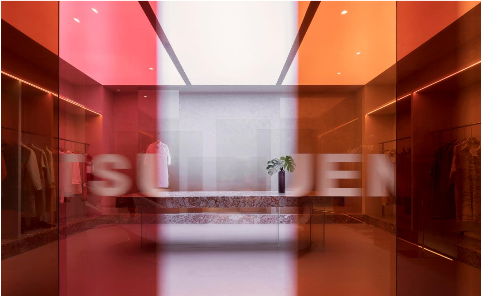
一场高级定制的主题大秀 在艺术装置“织物”上呈现戏剧性张力